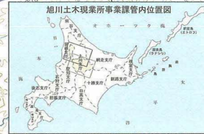
旭川土木現業所事業課管内位置図