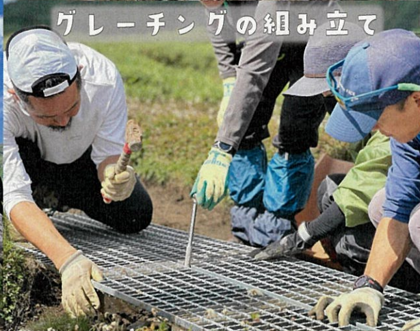
グレーチングの組み立て