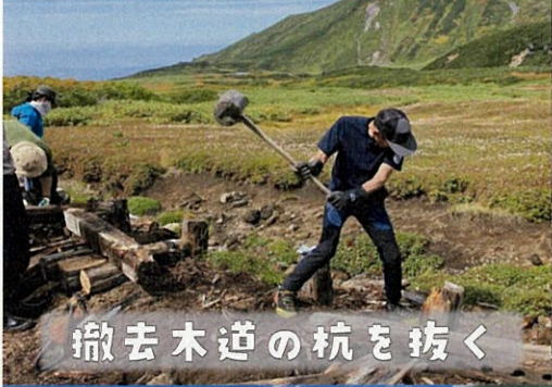
撤去木道の杭を抜く