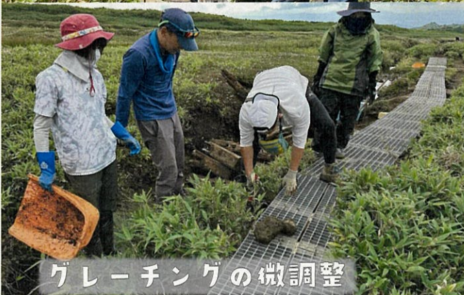
グレーチングの微調整