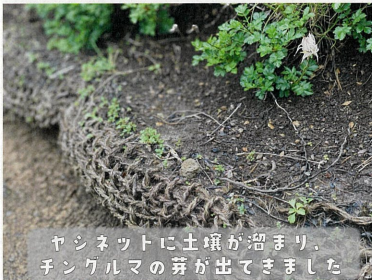
ヤシネットに土壌が溜まり、チングルマの芽が出てきました

少しずつ進めると、崩れた場所に植生が復元していく変化を見ながら、より良くなるよう微調整をしていくことができます。