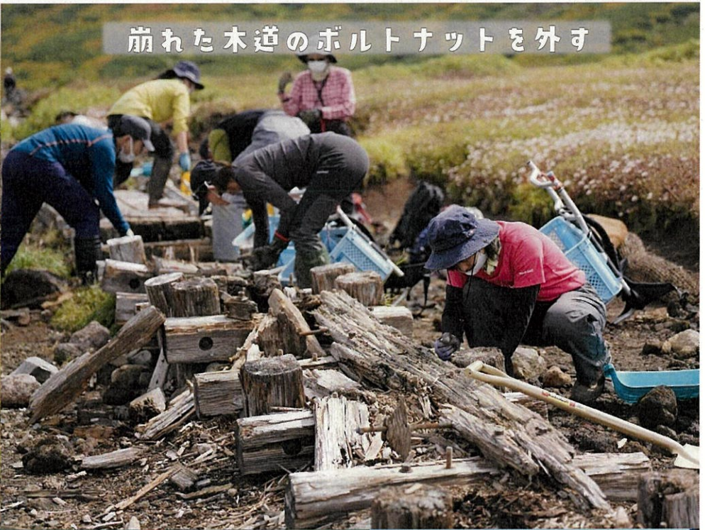
崩れた木道のボルトナットを外す