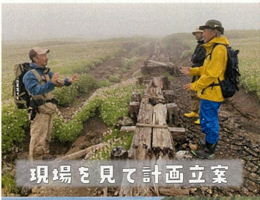
現場を見て計画立案