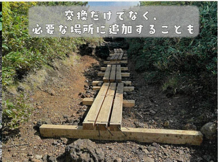
交換だけでなく、必要な場所に追加することも