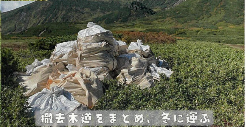
撤去木道をまとめ、冬に運ぶ