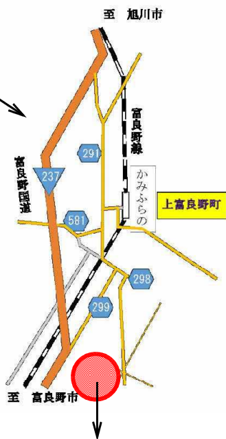
富良野食肉衛生検査所