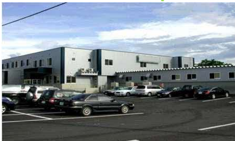
施設近景（かみふらの工房食肉センター）