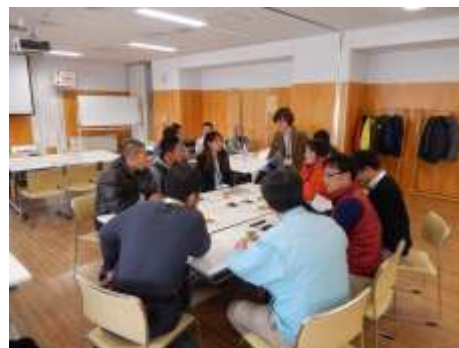
有機農業カフェでの情報交換

平成29年度も、会員のみさんの意見を伺い、活動を進めていきます。ご意見、ご要望がありましたら、ぜひ事務局までお知らせください。新年度の会員のみさんに農作業事故がなく、実り多いものとなりますようご祈念いたします。