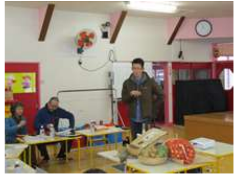
有機農業者による農場の紹介

平成29年11月29日にユリアナ幼稚園(旭川市神居)において、有機農産物の理解促進を目的に、幼稚園の父母会を対象とした「ランチ会」を行いました。ランチ会の内容は、①有機の食材を使ったお弁当の試食、②有機農業ネットワーク会員からの農場紹介、③かみかわ有機農業ネットワークの活動と有機農業について、④意見交換を行いました。