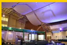
エコールなかがわ

まちの中心部をゆったりと流れる天塩川は絶好の釣りやカヌーポイントで、アウトドアスポーツを楽しむ人々が道内外から集結するまち。カヌーポイントがあるオートキャンプ場“ナポートパーク”には、温泉宿泊施設“ボンピラアクリズイング”があり、キャンパーにも広く利用されています。町内でクビナガリュウやアンモナイトの化石が多数発見され、エコミュージアムセンター“エコールなかがわ”で観察することができます。100kgの丸太を両方向から押し合う“丸太押し相撲”の発祥地で、収穫の秋を楽しむ“秋味まつり”で“丸太押し相撲大会”が開催されています。