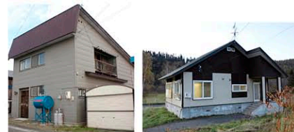
ちょっと暮らし住宅

【問い合わせ先】 美深町企業誘致・観光開発 移住対策推進協議会 (美深町総務課企画グループ) TEL(01656)2-1617