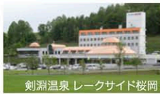
剣淵温泉 レークサイド桜岡