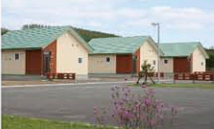
森のなか「ヨックル」