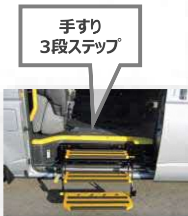
手すり 3段ステップ