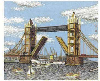
《ロンドンのタワーブリッジ》貼絵 1965年