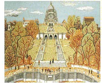
《パリのサクレクール寺院》貼絵 1962年 ©Kiyoshi Yamashita 2021