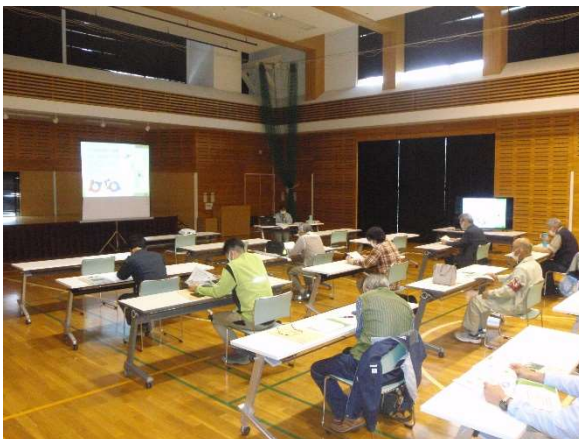
「次期整備管理計画」の考え方について説明