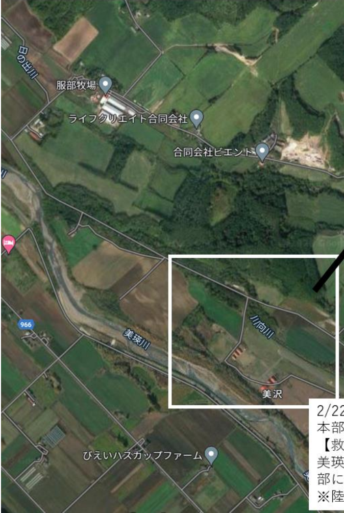
救助・救出訓練に係る訓練概要図