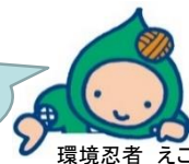
環境忍者 えこ之助