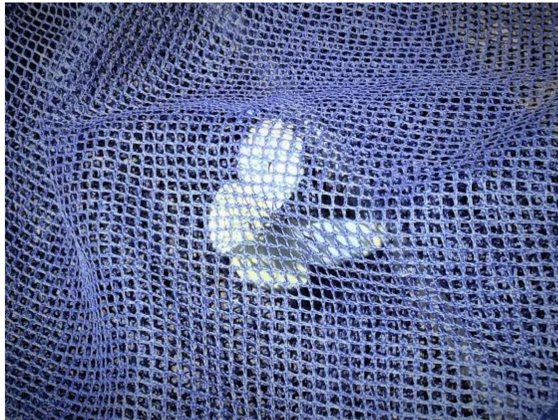
モンシロチョウの仲間