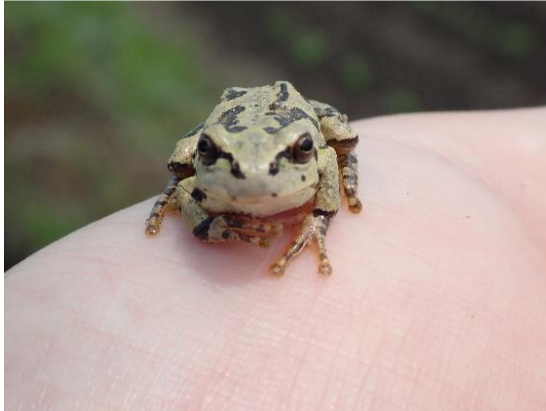
ニホンアマガエル