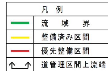
入志別川流域概要図