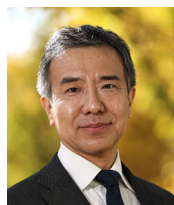
日本経済新聞 編集委員 太田 泰彦 氏

北大理学部で有機物理化学を学び、1985年日本経済新聞社に入社。 入社後、米国マサチューセッツ工科大学(MIT)に留学。 中国の「一帯一路」構想などに関する報道で2017年度ボーン・上田記念国際記者賞を受賞。 2004年～2021年には論説委員。 現在は東京を拠点に、外交、通商、イノベーションなどをテーマに取材活動をおこなっている。 その他、ダボス会議などの国際会議で講義、講演、モデレーションをおこなうほか、TVキャスターとしても活動。 日経新聞の1面コラム「春秋」を2005年から10年間にわたり執筆。 著書として「2030 半導体の地政学」、「プランナカン 東南アジアを動かす謎の民」などがある。