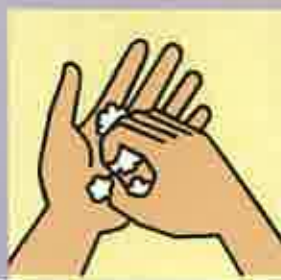
指先、爪の間 手のしわ