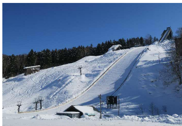
名寄市ピヤシリシャンツェ