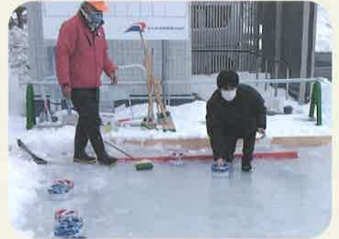
ピクルストーンカーリング

夏のパラリンピック種目のポッチャを冬でも楽しめるよう、防水加工したボールを使って雪上で行う北海道発の新スポーツ。