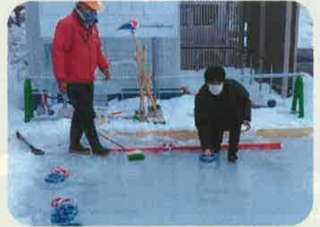
ピクルストーンカーリング

夏のパラリンピック種目のポッチャを冬でも楽しめるよう、防水加工したボールを使って雪上で行う北海道発の新スポーツ。