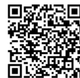
参加申込フォーム